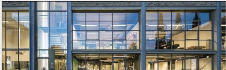
Transparante plint/gemengd met woningentrees