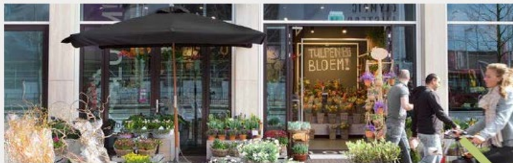
Stadsverzorgende bedrijvigheid, leisure, zorg en ambacht