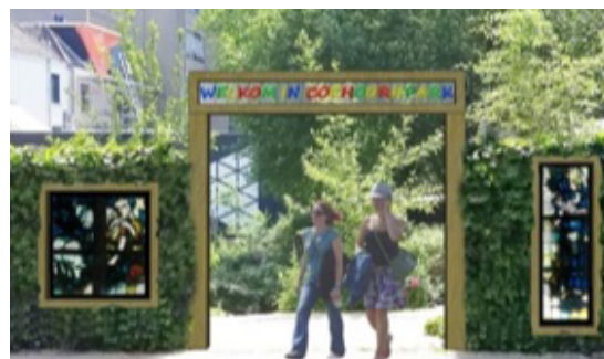
Beeld: Grip op beweging

Het PBA-plan verwacht dat met zo'n omgeving het Gele Ridders Plein een rol kan krijgen die enigszins te vergelijken is met het Coehoornpark. Dat was en is een ontmoetingsplek voor de creatieve sector. Andere invullingen kunnen ook de ontmoeting versterken: een buitenschoolse opvang, een sportschool of een wooncomplex voor ouderen. De plinten verdienen de aandacht van de transformatiemanager die actief is voor de gemeente in de Arnhemse binnenstad.